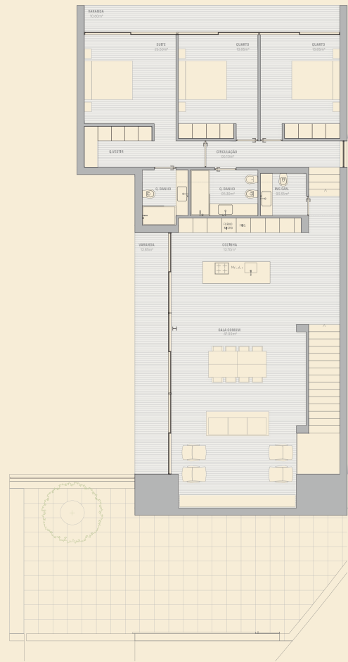
Planta Piso 2

A ÁREA BRUTA DE CONSTRUÇÃO CORRESPONDE À SUPERFÍCIE TOTAL, MEDIDA PELO PERÍMETRO EXTERIOR DAS PAREDES, INCLUINDO VARANDAS. AS ÁREAS INDICADAS NOS COMPARTIMENTOS SÃO ÁREAS ÚTEIS, MEDIDAS PELO PERÍMETRO INTERIOR DAS PAREDES E INCLUEM AS ÁREAS DOS ARMÁRIOS. NOTA: OS ELEMENTOS E INFORMAÇÕES CONSTANTES NESTE DOCUMENTO SÃO MERAMENTE INDICATIVOS, PODENDO SOFRER ALTERAÇÕES AQUANDO À EXECUÇÃO DA OBRA.