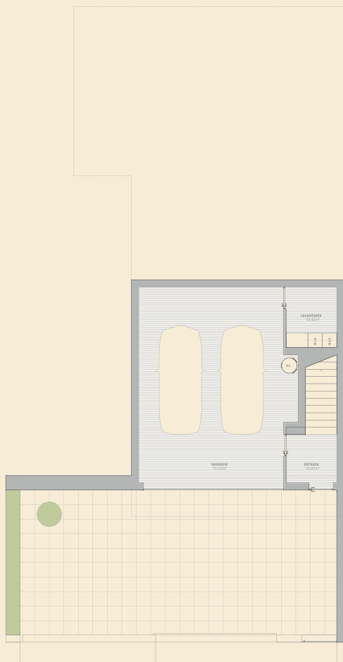
Planta Piso 1